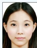
頭部比例 過大或頭 髮碰觸到 照片邊框