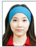
臉部及雙 耳被物品 遮蔽