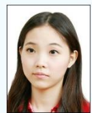
頭部側向 一邊、未 正視鏡頭