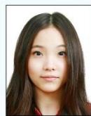
頭髮遮蔽 到眼睛或 耳朵